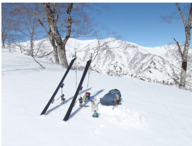
快晴の三国岳をバックにランチタイム