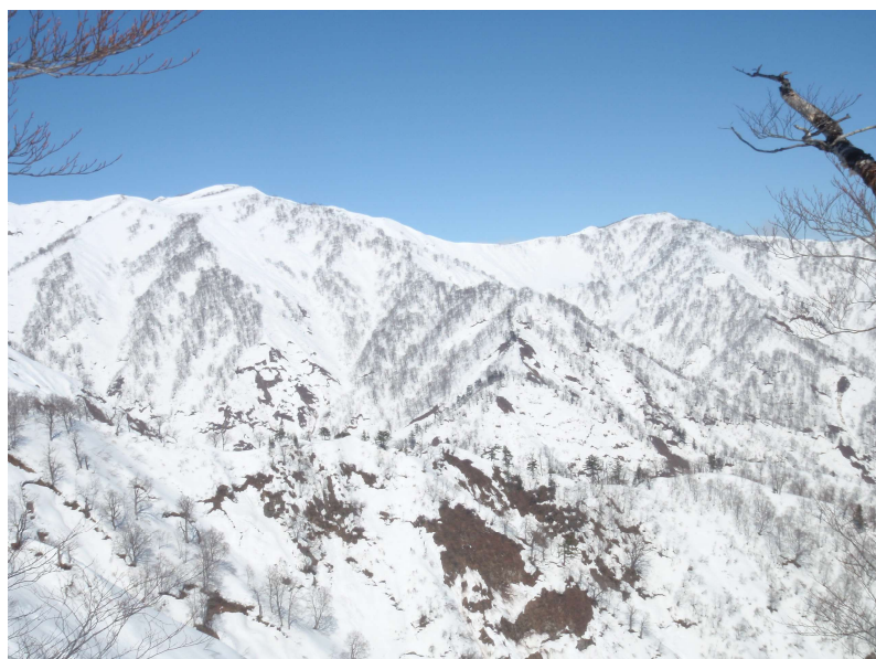
三国岳～剣ヶ峰～地蔵山

気持ちの良い斜面をゆっくり登って行き、山頂手前のジャンクションに乗ると、大日から牛首周辺の真っ白な山容や、かつて登った三部作の魅力的な尾根などが眩しく輝くのが望める。懐かしいような気持ちになりながら広大な山容を堪能して目の前の山頂を踏み、少し北側に移動すると、三国から疣岩周辺の稜線が手に取るように望むことができるため、無風快晴の中ここで絶景を眺めながらのお昼を楽しむこととする。カップラーメンとおにぎりだけの昼食なのだが、たった一人の何とも贅沢な時間である。