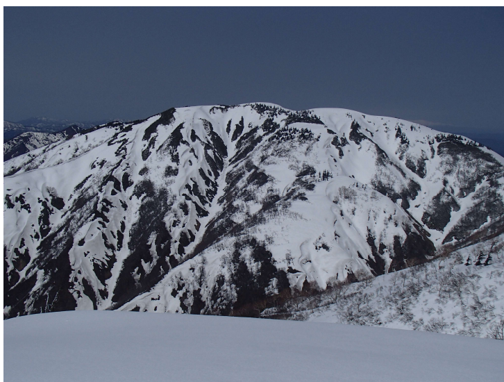
梵天から見る丸山岳

地球温暖化なのか、昨今の5月連休の山は雪が少なく、計画がたてづらくなっている。久しぶりに高幽山、梵天岳の山頂へ立てたのはとても良かった。機会があれば10回目の丸山岳山頂も果たしたいものである。