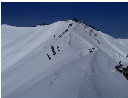
坪入山から西峰へのキレット