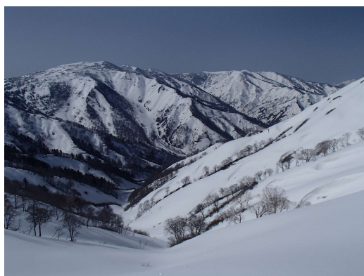
坪入のキレットから三岩岳方面を見る

窓明山から坪入山を目指す。窓明山頂北側は雪庇が崩壊し藪漕ぎとなるが、すぐに残雪の上を歩けるようになる。雪面にはアイゼンのトレースが付いている。天気は回復する様子はなく、あいかわらず雪が舞う。13時35分、坪入山南側標高1680m付近の針葉樹の中にテントを張り行動終了とする。テントの中で角瓶を飲みながら体を温める。天気は悪化し雷が鳴り出す。5月連休の山で雷に会うのは初めてである。