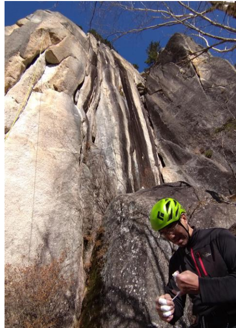
十一面岩末端壁にて

点にたどり着き、トップロープをセットする。休日には順番待ちのクライマーで大人気のここ末端壁にも平日の今日は誰もおらず、貸し切りだ。気兼ねなくトップロープで練習できる。思ったほど難しく無かったので、次来た時には本気トライしたい。となりのトワイライト 5.11c も最後にやってみるが、全く歯が立たない。こちらは、また別格だった。