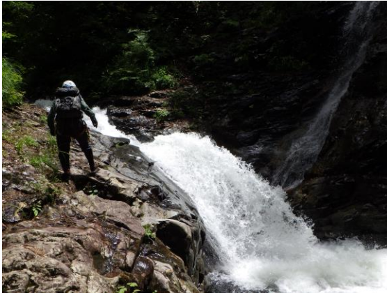
東黒沢中間部の滝

巻きした滝は 2 つだけであった。次の支流の出合は左が本流である。そこを遡行していくとありました。延々と続くナメが。これでもか、これでもかと続きます。長いこと沢登りをやっていますがこんなに続く美しいナメ滝は初めてです。今回の目的は達成されました。