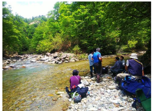
叶津川と赤崩沢の出合い