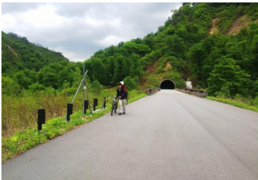
長いトンネルを抜けて

やっと叶津川へ降りる。森からいきなり開けた場所にでた。対岸に渡っても踏み跡は続き、引入沢出合まで続いていた。左岸の台地はコゴミの畑で、その中にサンカヨウの白い花があった。本当に久しぶりに見たので感激だった。赤崩沢出合で沢の流れの音を聞きながら昼食