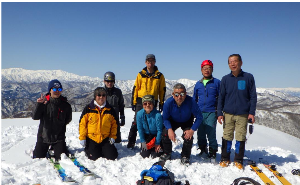
喜多方から登って方にとってもらった