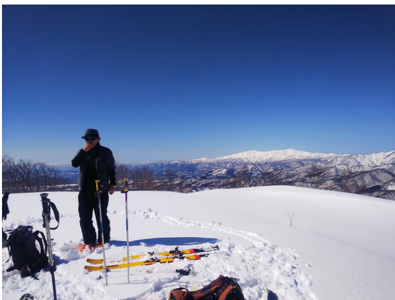
山頂は遮るものがない絶好の展望台